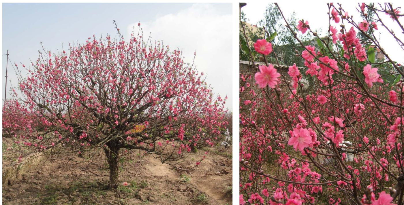
Với mỗi gia đình miền Bắc, màu hồng phai hay thắm của những cành đào không bao giờ thiếu khi Tết đến.