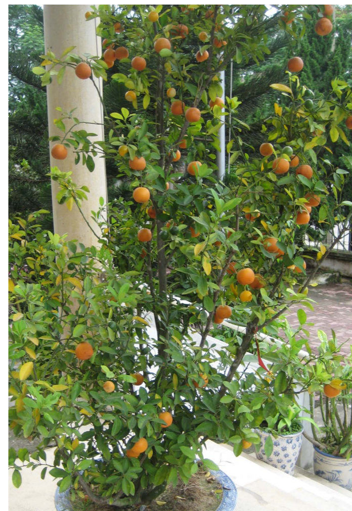
Cây quất trong quan niệm dân gian còn là biểu tượng sức khỏe, bình an, trường thọ và sự may mắn trong tình duyên.

Cần phải vứt hoa đi trước khi hoa héo ngay trong chính nhà bạn đầu năm mới. Trong phong thủy, nếu đầu năm mà chứng kiến hoa héo, trong nhà có sự chia cách hoặc tranh chấp.